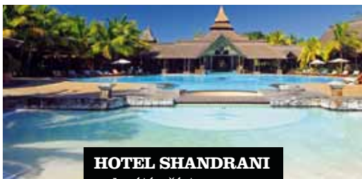
HOTEL SHANDRANI uchvátí přístupem do laguny Blue Bay