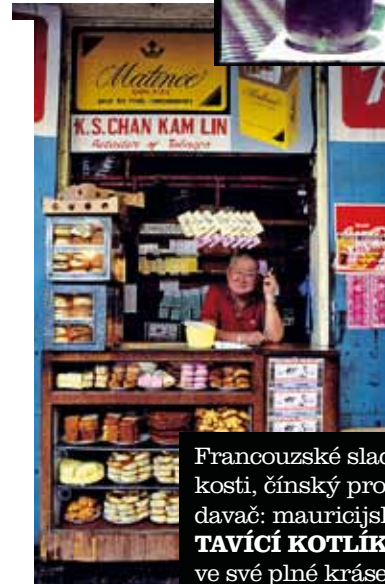
Francouzské sladkosti, čínský prodáváč: mauricijský TAVÍCÍ KOTLÍK ve své plné kráse